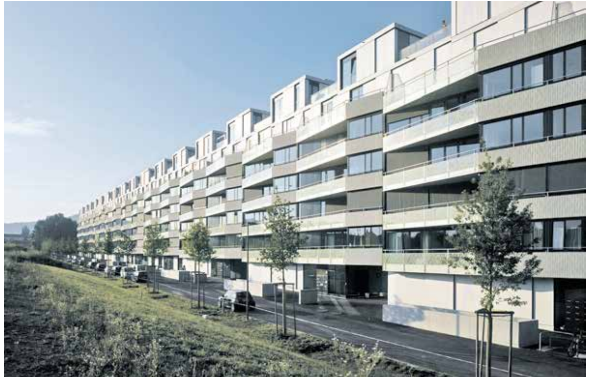
Mit 225m Länge erscheint die Hardegg gegen Norden wie die Tribüne der Weissenstein-Sportanlagen. Fotonachweis: mrh architektur, Bern

Sowohl im Steinhölzli als auch hier haben wir versucht, mit Leuten über den Grenzverlauf ins Gespräch zu kommen. Er scheint sie herzlich wenig zu beschäftigen: Ja, die Abfallsäcke haben eine