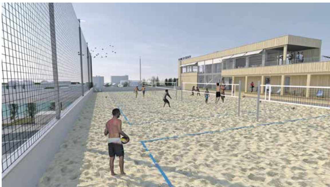
So werden sich die vier Spielfelder auf dem Dach präsentieren. Visualisierung: Home of Beach AG.

Der Verein Beachvolley Bern wurde 2007 gegründet und errichtete auf einem Areal eines Tennisplatzes an der Goumoënsstrasse beim Steinhölzliwald das Beachcenter Bern, das umgehend zum