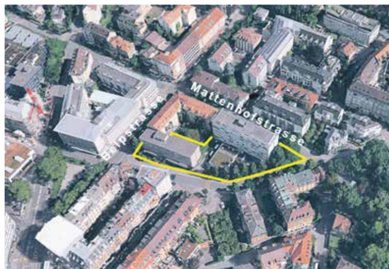
Der Gebäudekomplex, der saniert und umgenutzt wird. (Bild: GoogleEarth)

Zugunsten eines zusammenhängenden Gartenraums für die neu