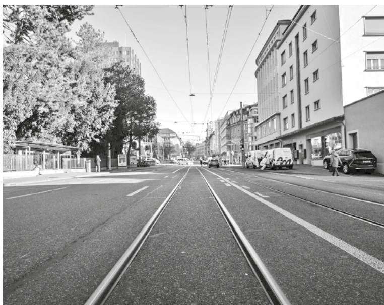
Die Effingerstrasse ist mehr als nur eine Verkehrsachse.