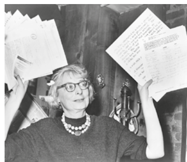
Jane Jacobs (1961)

Auf https://janeswalk.ch unter «Teilnehmen» finden Sie weitere Walks sowie Informationen dazu, wie sie zukünftig selbst einen Walk organisieren können.