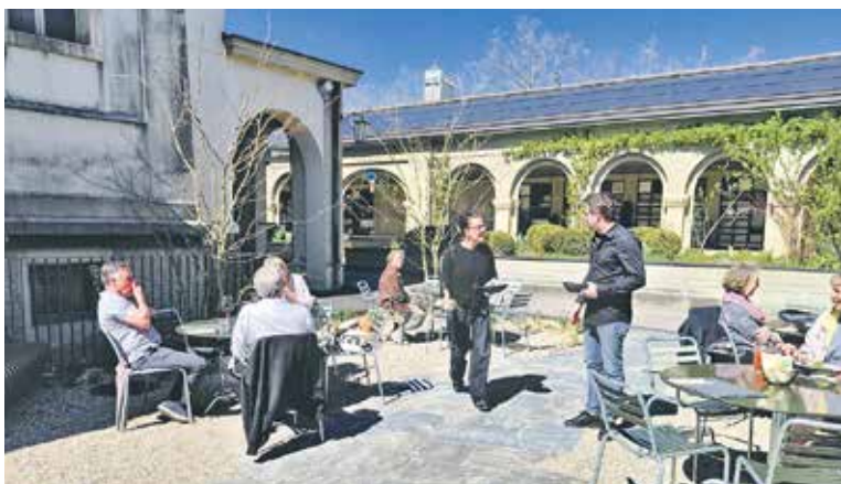
Der Innenhof träumt bereits von lauen Sommertagen...

Montag bis Freitag 9 – 19 Uhr Juni, Juli, August: 10 – 20 Uhr Samstag/Sonntag geschlossen