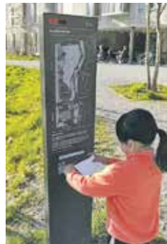
Infosteile mit Parkbriefkasten

Für die Nutzungsentwicklung braucht es weitere Rückmeldungen aus dem Quartier . Diese können per Mail an holligenpark@bern.ch oder auf Papier in die Infosteile gelegt werden. Im Café