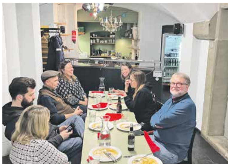
Die «helfenden Hände» der Konzerte im Partyraum der Villa Stucki