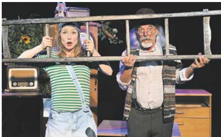
Theater für alle ab 4 Jahren