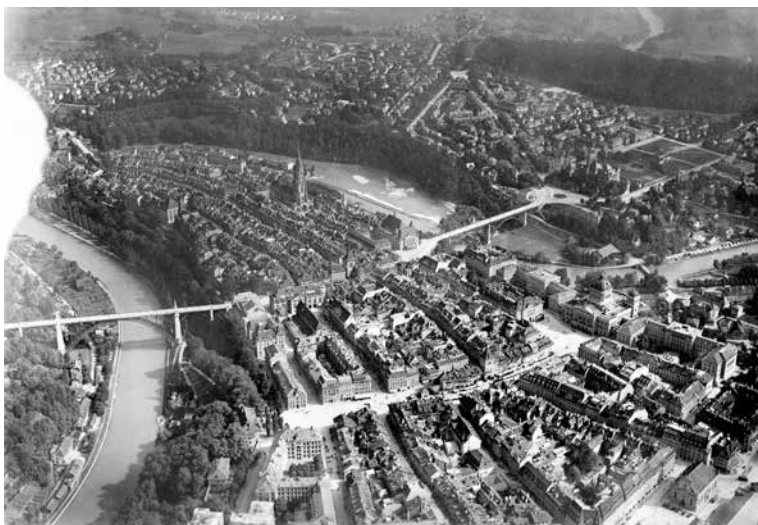
Bern um 1920. Die Stadt ist bereits deutlich über den mittelalterlichen Kern hinaus gewachsen: Der Ob- und Untersberg ist komplett bebaut, das Kirchenfeld dagegen erst ansatzweise.

«Köniz untenaus» ist mit Bern verwachsen, Agglo eben, «Köniz oben aus» ist Teil vom Schwarzenburgerland mit Sense und Schwarzwasser.