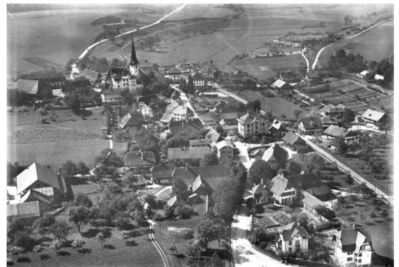
Das Zentrum der Gemeinde Köniz, ca. 1920. Im Gegensatz zu Bern hat hier Wachstum noch kaum stattgefunden. Die Häuser könnte man schnell zählen und gut vorstellen kann man sich auch, wie es Richtung Bern noch viel offenes Land gibt. Köniz-Gartenstadt bestand aber schon (1916)!