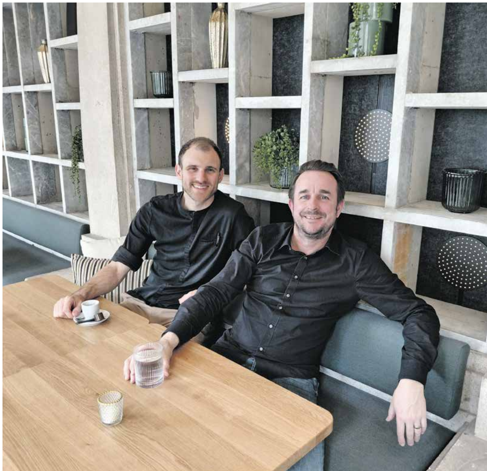
Die stolzen Chefs des neu eröffneten Restaurants LA VIE in ihrem Wintergarten, der ehemaligen Urnenhalle. Seite 6

Holligen-Fischermätteli Weissenstein Mattenhof Monbijou Weissenbühl Schönau-Sandrain Marzili