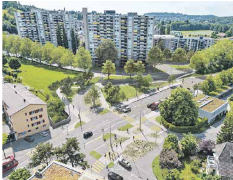
Visualisierung der neuen, umstrittenen Tramwendeschleife im Sandrain. (Grafik: seftigenstrasse.be)

In der Bauprojektierung wurde eine Lärmschutz-Massnahmenprüfung durchgeführt. Aufgrund dieser wurde festgelegt, dass auf