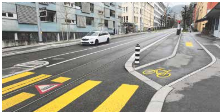
Hier hat das Velo mehr Platz erhalten im Quartier.