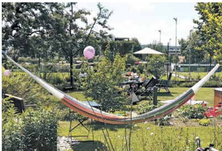
Der Platz geht uns in den Städten aus: Verdichten, Aufstocken, Weiterbauen lauten Schlagwörter auf der Suche nach Rezepten. Glücklicherweise, wer noch so in Zentrumsnähe wohnt und seine Kinder im Grünen aufwachsen sehen kann!

Stets geradeaus, sind wir jetzt an einem veritablen Platz angelangt. Das sonst weitgehend gleiche Baumuster variiert hier, die vier deutlich grösseren Gebäude sind