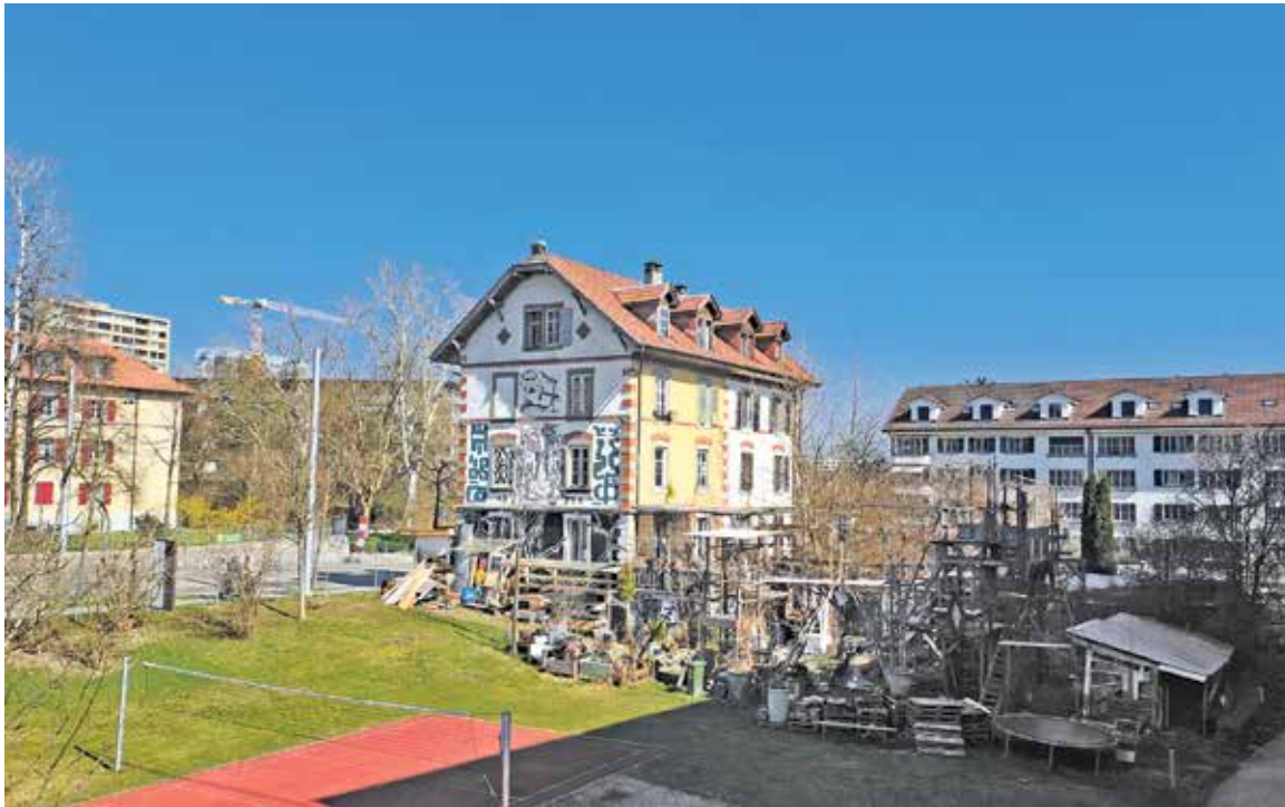
Die Liegenschaft an der Freiburgstrasse 129 und 131 soll bald abgerissen werden