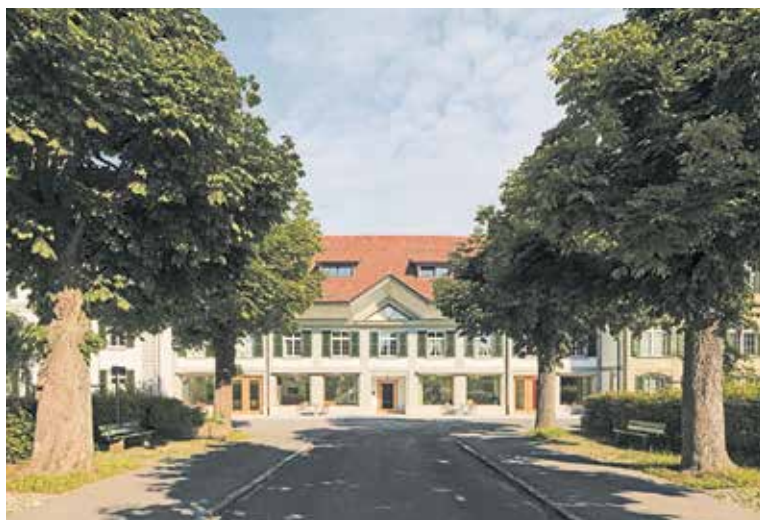
Dieser prägnante Giebel steht selbstbewusst am Ende der Dübystrasse. Beim Näherkommen merkt man erst, dass er nur den Mittelteil zweier viel grösserer Gebäude darstellt.

In der wirren Zeit nach dem 1. Weltkrieg war auch in Bern die Wohnungsnot riesig und eine Lösung bestand in der Gründung von Baugenossenschaften. Doch auch diese Genossenschaften hatten grosse Schwierigkeiten und nicht zuletzt auch Vorurteile zu überwinden. Etliche Male