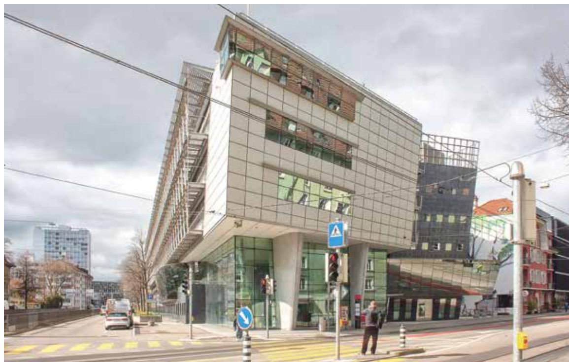
Das literarische Gedächtnis der Schweiz kommt für mehrere Jahre in die Titanic II.

onalbibliothek und das Bundesamt für Kultur (BAK) braucht es an der Titanic II besonders für die öffentlichen Publikumsbereiche, also Bibliotheksnutzungen wie Ausleihe, Lesesäle usw. sowie für betriebsspezifische Flächen wie Atelierräume, spezifische Umbauten. Bereits das ganze letzte Jahr wurden in den zugänglichen Flächen gestaffelt Umbauarbeiten durchgeführt. Und die Bauarbeiten sollen noch das ganze Jahr 2025 andauern. Die Bibliothek hofft darauf, die Titanic II ca. Anfang 2026 in Betrieb nehmen zu können. Als Nationalbibliothek-Provisorium wird sie dann bis mindestens Ende 2030 dienen.